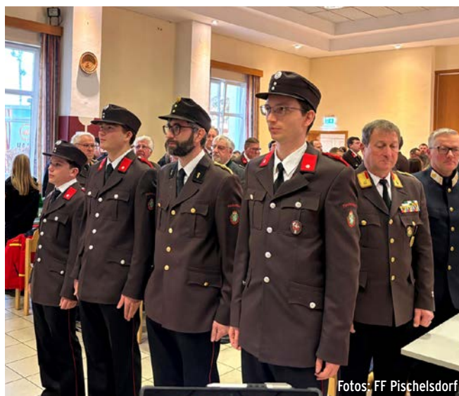
Feierliche Angelobung von vier neuen Kameraden im Aktivist